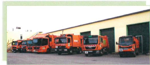
Unsere Fuhrparkflotte

Verantwortungsvolles und transparentes Wirtschaften dienen der Gebührenstabilität für die Bürgerinnen und Bürger. So entsteht eine bezahlbare Daseinsvorsorge, die sich aus den Abfällen der Bürger refinanziert.